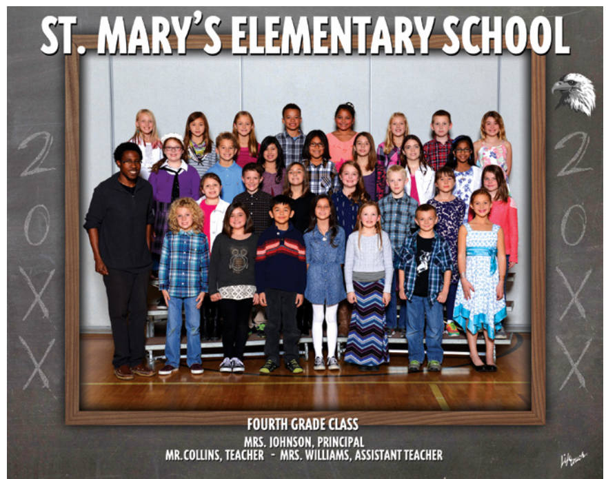
Design and class posing may vary by school. La pose de la clase y el diseño pueden variar según la escuela.